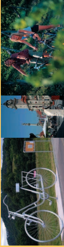
Leibnitz und Kaindorf an der Sulm: Das Radzentrum im Südsteirischen Weinland