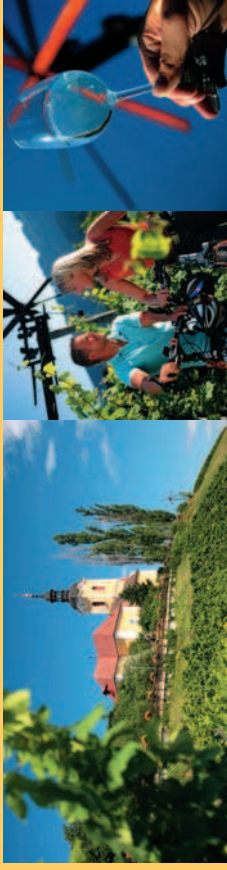
In Kitzzeck erleben Sie höchstes Weingenus