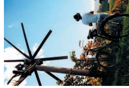
Hier werden sie vom Windspiel des Klappnetzes begrüßt

Als Ausgangspunkt der Sausaler Tour wählen wir den Ort Heimschuh. Vom Parkplatz beim Gemeindefeuerwehr können wir uns für die Hauptroute entlang der Sulm Richtung Fresing-Gleinstätten, oder die Variante über Einöd nach Kitzreck entscheiden.